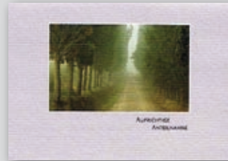
„Allee“ Best.-Nr. 09T149 • 1,75 €