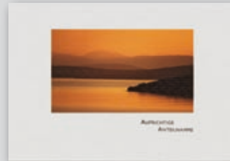
„Abendstimmung“ Best.-Nr. 09T148 • 1,75 €

Bitte abtrennen und im frankierten Fensterumschlag einsenden.