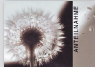
„Löwenzahn“ Best.-Nr. 10T150 • 1,75 €