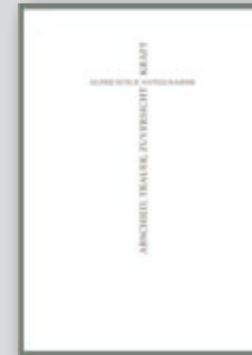
„Kreuz“ Best.-Nr. 06T146 • 1,45 €